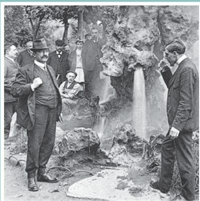
Le geysir des Baignots.

Des eaux minérales sont issues d'un processus multimillénaire permettant aux eaux de pluie de s'infiltrer dans les couches souterraines et de se charger en sels minéraux et en oligo-éléments. Ces nappes d'eau entrent alors parfois en contact avec une faille puis remontent par des voies naturelles en se réchauffant au contact de la roche, il s'agit d'eau thermale dont la température peut atteindre 64°C. Toutes ces eaux possèdent des particularités physico-chimiques et microbiologiques rares.