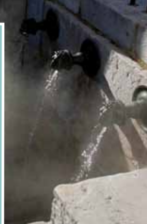
La source de la Nêhe (Fontaine Chaude)

Héritage de la formation des Pyrénées, le site géologique dacquois est particulièrement complexe. Le bassin du Bas-Adour s'impose alors comme un point d'émergence des eaux.